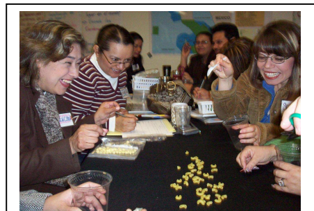
Educadores de COBACH y CONANP haciendo la actividad "Picos y patas" sobre adaptaciones

El taller piloto se impartió a 41 maestros del COBACH de 17 planteles en el estado, un inspector de Secundaria de Tijuana, y nueve miembros de la CONANP, la dependencia a cargo de las áreas naturales protegidas en México. Las siguientes etapas incluyen producir la versión final del currículo en español y traducirla al inglés, así como obtener fondos para hacer el programa continuo y sustentable.