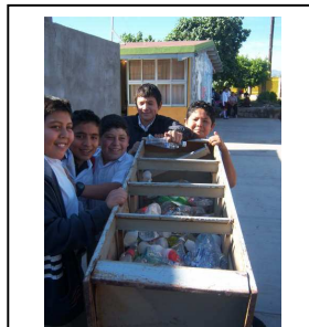
Estudiantes presumiendo sus materiales reciclados. Loreto, BCS.