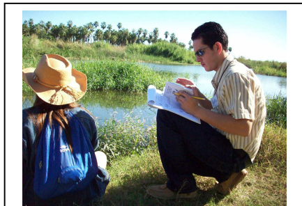
Participantes haciendo observaciones de la naturaleza en el Estero de San José, Los Cabos, BCS.

Durante el otoño del 2008 impartimos tres talleres normales y un taller para capacitadores de Nuestro Patrimonio Natural en BCS. En La Paz tuvimos 23 participantes en el taller normal y se capacitaron siete capacitadores; Loreto tuvo 11 participantes, y Los Cabos 30 participantes. Todos ellos están implementando sus proyectos y salidas de campo. Se tienen planeadas las celebraciones por el cumplimiento de proyectos en BCS para la última semana de abril. Este programa, implementado durante los últimos tres años con fondos de ICF, ha servido para capacitar 296 educadores de Baja California Sur, quienes a su vez tienen ingerencia sobre 20,000 estudiantes y otras personas en 146 escuelas y organizaciones. Cada uno de los participantes en los talleres se compromete a realizar un proyecto en beneficio del medio ambiente de su comunidad, con resultados tangibles y medibles, que llevan a un cambio de actitud hacia el medio ambiente de por vida.