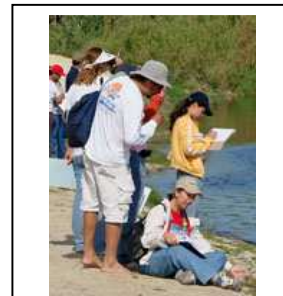
Más observaciones, Estero de San José, Los Cabos, BCS.